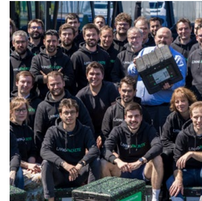
Les équipes LivingPackets